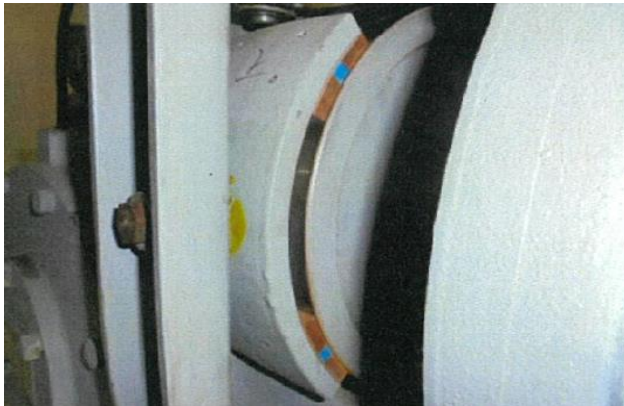
※ドラム式（パッド片側上下の2分割）